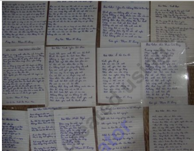
Hàng chục bài thơ, bài hát được Long viết bằng miệng nhưng chữ rất đẹp