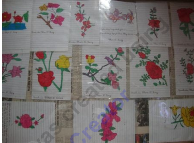
Những cành hoa, từng đôi chim trên cành là tác phẩm đầu tiên bằng miệng

miệng: Miệng ngậm bút rồi dùng hai hàm răng nghiền chặt bút và đưa từng nét chữ tròn trĩnh, đẹp đẽ.