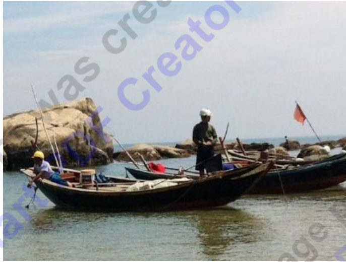
Chuẩn bị ra khơi.

TP - Ngư dân vùng ven biển Kỳ Anh - Hà Tĩnh đang vào vụ mực. Ngày ngủ, đêm thức trắng, để từng đoàn thuyền ra khơi. Ra biển săn mực, mới hiểu được vì sao ở đây lại có thứ mực cơm ngon đến như vậy, nhất là loài mực nhầy ở vùng biển Vũng Áng.