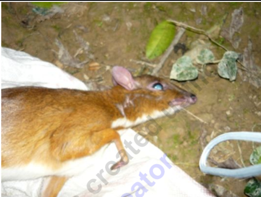
Những con thú hoang này đang ngày đêm trước nguy cơ bị săn bắn, giết hại

Và chỉ một ngày sau đó, tôi nhận được điện thoại từ L với nội dung “ có một con khỉ mà người ta vừa đánh bắt được, chỉ bị thương ở tay, anh có mua không, giá là 280 nghìn/kg. Nếu anh không mua thì e cũng lấy nấu cao dùng”. Để từ chối thì tôi đánh lừa L rằng tôi đang có việc phải đi xa nên không thể mua được.