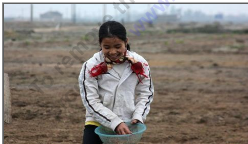
Tiếc đất để hoang tại các khu TĐC, người dân Thạch Khê tranh thủ ra cấy trồng

Liên quan đến những chỉ đạo của Phó Thủ tướng Hoàng Trung Hải tại Văn bản 52 ngày 17/2/2012, trong đó có việc giao cho Bộ Công Thương chỉ đạo Tập đoàn Than khoáng sản VN, Cty TIC... phân tích, đánh giá lại toàn bộ Dự án về cơ cấu sản phẩm, thị trường tiêu thụ, phương án huy động vốn, hiệu quả dự án... để khẳng định tính khả thi của dự án, báo cáo Thủ tướng Chính phủ trong tháng 6/2012.