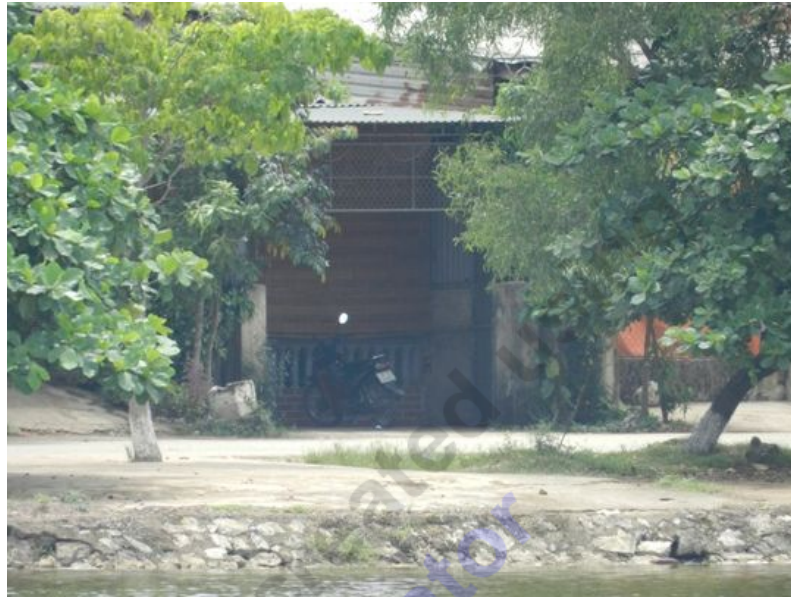
Một trong những quán mại dâm trá hình

Lấy lý do “hàng” các em không được chuẩn, không thích, tôi xin phép được rời “tổ”. Vừa ngoảnh mặt đi tôi đã bị mấy em buông mấy lời "nhận xét"... nổi cả da gà.