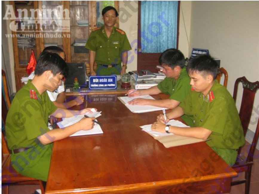
Họp ban chuyên án tổ chức truy bắt tội phạm

ANTĐ - CATP Hà Tĩnh cho biết, đã bắt được 2 đối tượng gây ra vụ cướp của, hành hung gây thương tích cho nạn nhân, xảy ra lúc 1h30 ngày 22-8 tại khu vực công viên mới, đoạn giáp ranh giữa phường Nam Hà và phường Văn Yên - TP Hà Tĩnh.