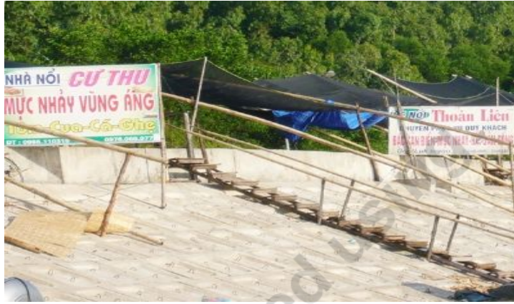
Tại cầu cảng số một cảng Vũng Áng có hàng trăm biển hiệu đề bán mực nhảy.

Theo một số chủ nhà hàng, cũng không hiểu vì sao nước biển ở Vũng Áng lại có thể nuôi được mực sống. “Nhiều người không tin, còn ra tận bè để yêu cầu vớt mực lên, lúc đó mới tin là mực đang sống” - một chủ nhà hàng nói.