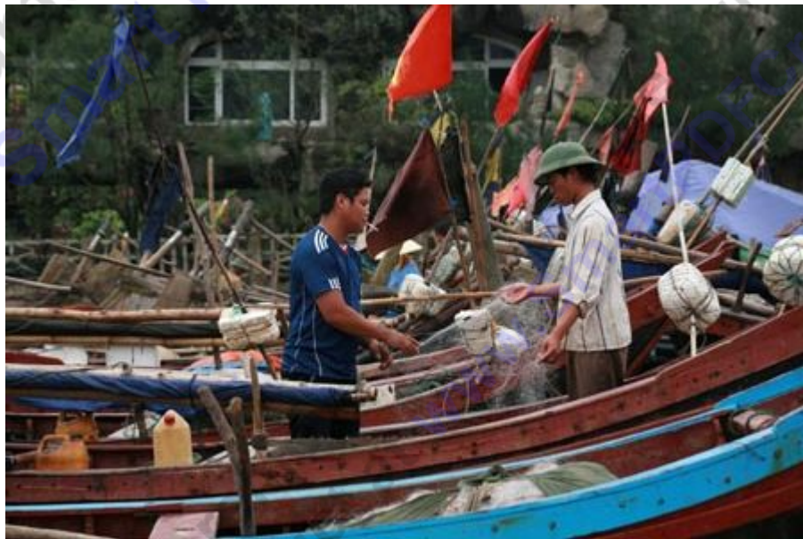
Ngư dân các xã ven biển từ huyện Nghi Xuân đến Kỳ Anh đã được thông báo về vụ tai nạn.