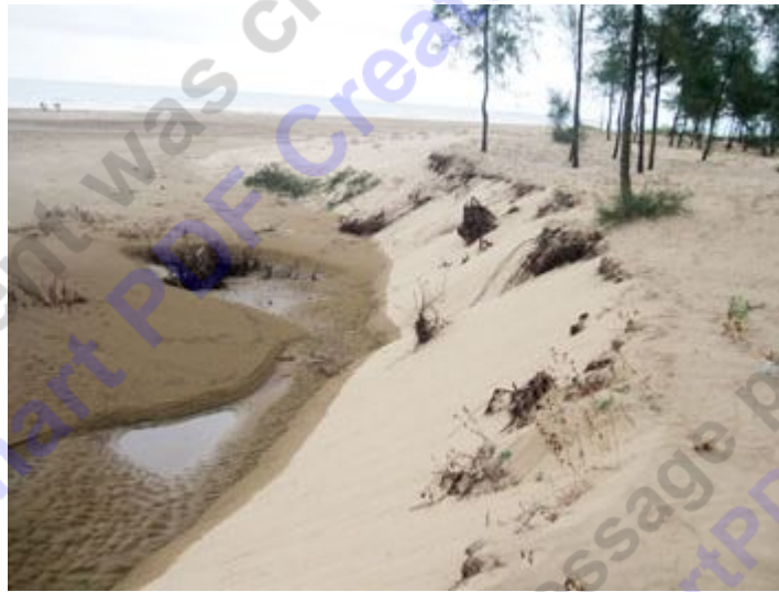
Sóng đã cuốn trôi một phần lễ rừng chắn sóng nhưng bên trong là một vùng đất trống hoác

Tháng 5-2008 Dự án khu du lịch biển và sân golf Xuân Thành được cấp phép xây dựng. Những tưởng dự án này sẽ sớm biến xã Xuân Thành nói riêng, huyện Nghi Xuân nói chung có một diện mạo mới vì đây là một dự án tầm cỡ rất lớn. Theo dự kiến, ngày 12-12-2012 dự án sẽ được đưa vào khai thác, thế nhưng đến nay vẫn đang loay hoay ở khâu giải phóng mặt bằng và thêm một nỗi lo nữa đó là mất rừng phòng hộ.