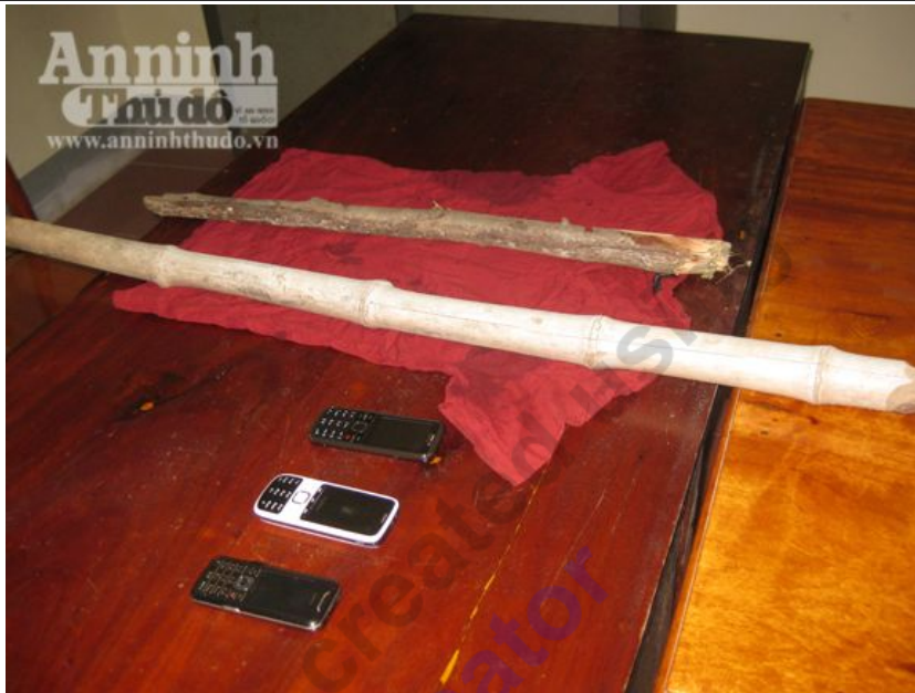
Hung khí và tang vật củ vụ án

Qua đó cơ quan CSĐT đã bắt khẩn cấp đối tượng Hồ Bá Vũ (trú tại khối phố 5-phường Đại Nài - TP Hà Tĩnh) khi đối tượng này đang lẩn trốn tại quê ngoại của hắn tại xã Cẩm Vịnh - huyện Cẩm Xuyên- Hà Tĩnh.