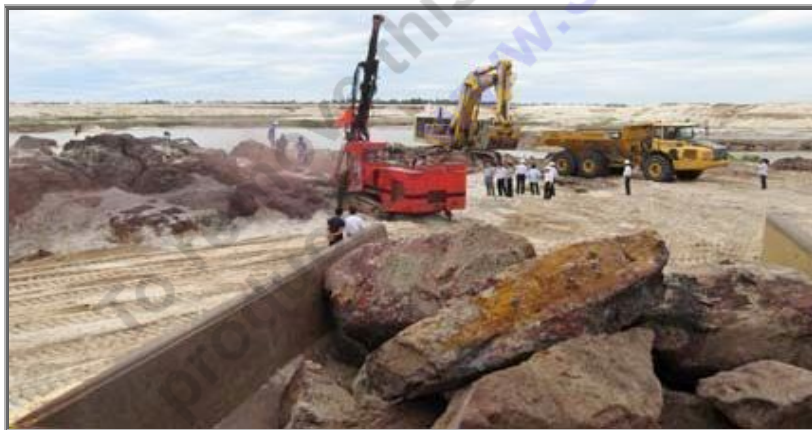
Phần lớn người dân vùng mỏ thấy phấn khởi, tuy nhiên, những lời hứa của DN đối với dân thì vẫn chưa được thực hiện, họ vẫn đang chịu khổ.

Tuy nhiên, vị TGD cũng không thể biết được thời gian nào sẽ hoàn thành việc mua bán, có tiền để giải quyết các vấn đề dân sinh cần phải làm. “DN nào đăng ký mua thì chúng tôi buộc phải đưa tiền trước mới bán, không thì thôi”.