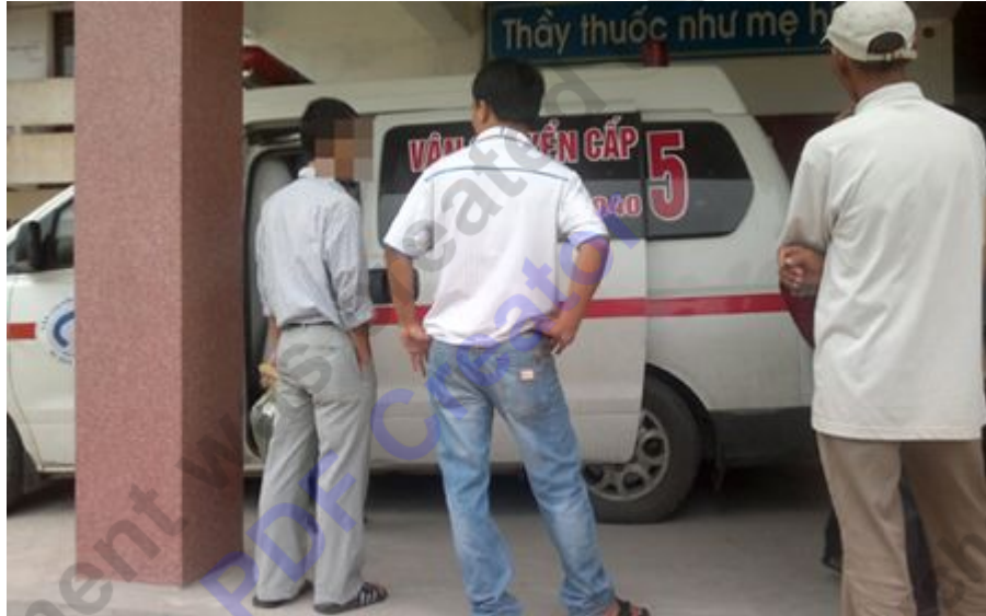
H. được chuyển từ BVĐK Hà Tĩnh lên Viện Bỏng quốc gia

người. Khoảng 16h cùng ngày, khi D. đang cùng bạn lau dọn, vệ sinh phòng học ở tầng trên, H. giả vờ đau chân, xin cô giáo lên tầng trên để tìm D. Thấy D., H lấy chai xăng tưới lên người rồi châm lửa, sau đó lao thẳng vào D. Ngọn lửa bốc cháy dữ dội khiến nhiều học sinh hoảng loạn. Một số học sinh nam dội các chậu nước lên người H. nhưng khi ngọn lửa được dập tắt thì H. đã bỏng rất nặng. H được đưa tới BVĐK Hà Tĩnh sơ cứu trước khi chuyển thẳng ra Viện Bỏng quốc gia. D. may mắn không bị ảnh hưởng.