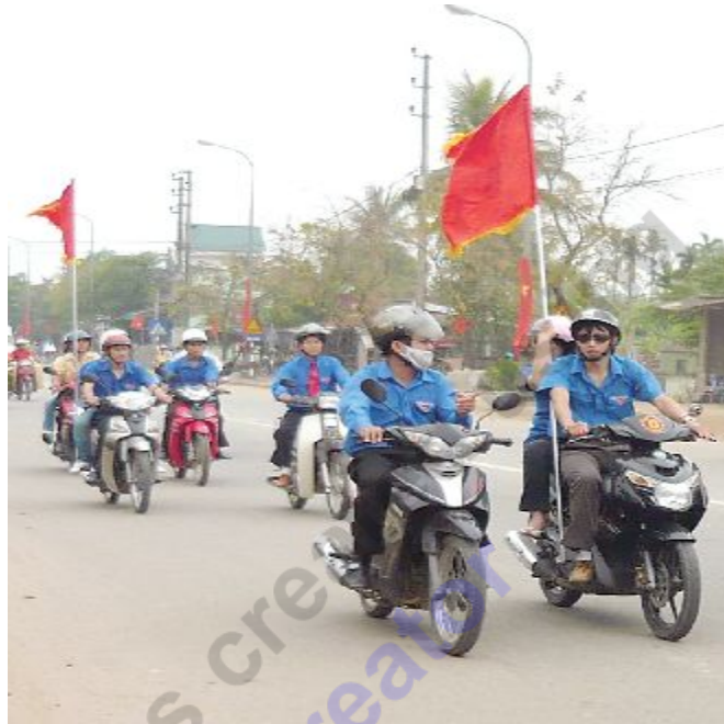
Thanh niên Hà Tĩnh trong ngày ra quân thực hiện Năm An toàn giao thông 2012