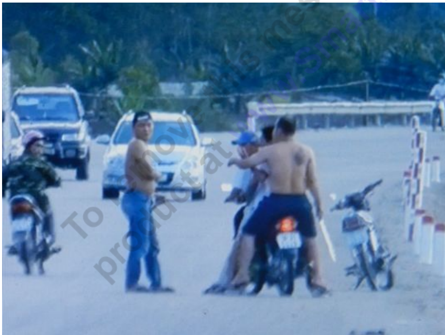
Nhóm côn đồ này ngang nhiên vác đao, kiếm rượt đuổi xe khách

Khi gặp chiếc xe khách 16 chỗ đang lưu thông tuyến Vinh-Hà Tĩnh, thì thấy một thanh niên ngồi sau xe máy vung dao lên chỉ thẳng vào chiếc xe khách. Cả nhóm quay xe lại đuổi theo chiếc xe khách nói trên. Rượt đuổi chiếc xe khách chừng khoảng hơn 1km thì xe máy của nhóm côn đồ chạy vượt lên trước đầu chiếc xe khách. Đến đoạn cầu Giăng (km 471-062.793 QL1) chúng dừng xe máy lại ý định chặn chiếc xe khách, tại thời điểm đó có 3 đối tượng khác đã có mặt ở cầu Giăng từ trước để mục đích hỗ trợ đồng bọn.