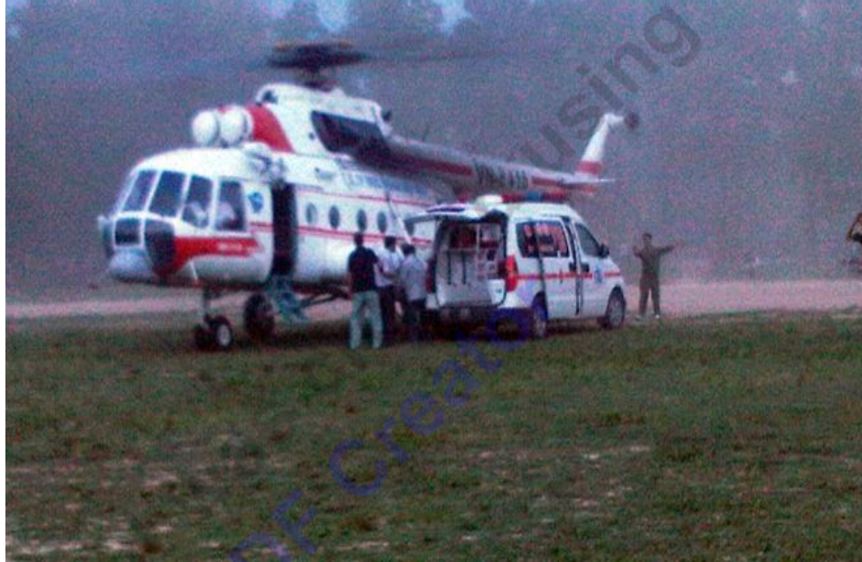
Chuẩn bị đưa bệnh nhân lên máy bay trực thăng