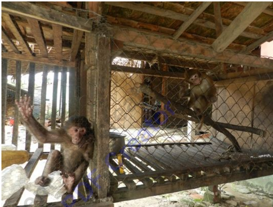
Lâu nay, tình trạng săn bắt, mua bán và nuôi nhốt thú rừng ở Vườn quốc gia Vũ Quang vẫn ngấm diễn ra

“hàng” từ trong vườn quốc gia ra hầu hết là vào ban đêm, tùy vào ca trực kiểm tra, kiểm soát mà L gọi là “người quen”. Tôi có thể nhận “hàng” trực tiếp từ L, hoặc L sẽ gửi về tận thành phố Vinh thông qua xe ô tô khách cho tôi.