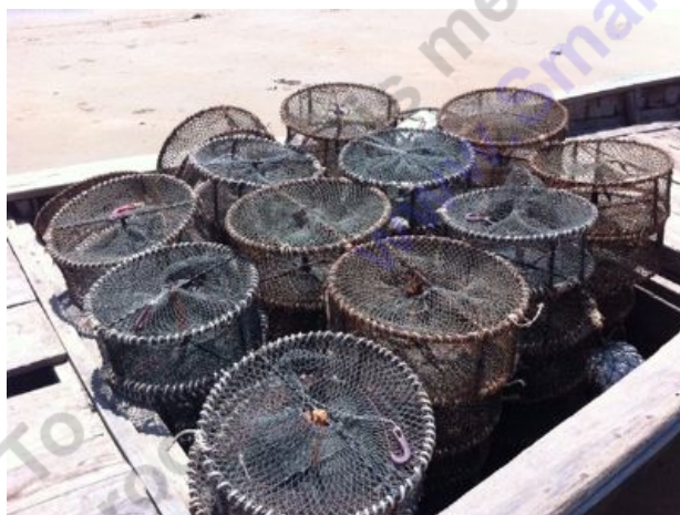
Dụng cụ để câu mực.

Những đêm nhiều mực, tay cứ thoăn thoắt biểu diễn hết đánh thẻ lại chuyển sang câu. Tiếng mực nhả bọt loẹt xoẹt nghe rất vui tai.