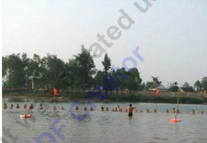
Lớp học bơi của thầy Lê Văn Tùng nay trở thành CLB thu hút nhiều học sinh

Khai giảng từ mùa hè năm 2005, lớp học bơi của thầy thu hút học sinh trong huyện và cả thành phố Hà Tĩnh. Lớp học ngày một đông hơn, nhất là vào những dịp hè, trung bình mỗi năm có hàng trăm học sinh tham gia. Học sinh đến đây không chỉ được trang bị các kỹ thuật bơi thông thường mà còn được hướng dẫn các phương pháp cứu đuối và lánh nạn cơ bản khi gặp các tình huống nước chảy xiết. Điều đáng ghi nhận nữa là từ khi có hoạt động này, tại địa phương, không còn tình trạng trẻ em đuối nước diễn ra như trước đây.