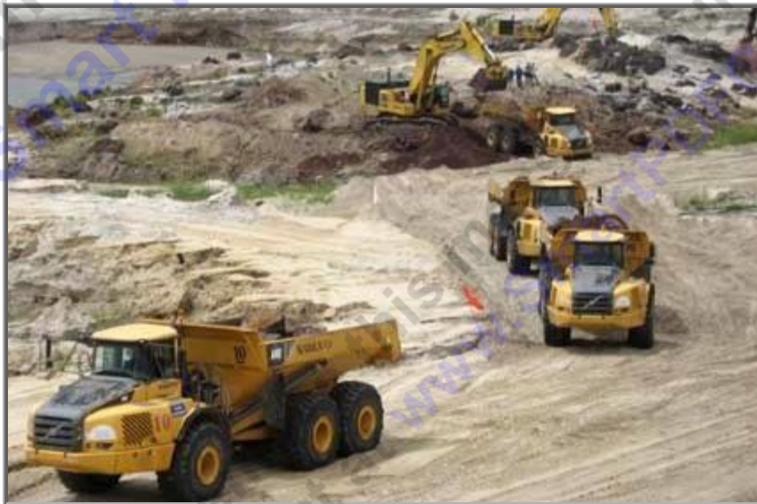
Những tấn quặng đầu tiên tại Mỏ sắt lớn nhất ĐNA đã được đưa lên.

Những ngày cuối tháng 7/2012, hàng nghìn người dân ở khu vực Mỏ sắt Thạch Khê không khỏi ngỡ ngàng khi chứng kiến cảnh Cty CP Sắt Thạch Khê (Cty TIC) tiến hành khoan những mũi khoan đầu tiên vào khối quặng khổng lồ nằm dưới lớp tầng phủ để đưa quặng lên khỏi mặt đất. Vậy là mong ước bao đời của người dân nhìn thấy “đồng vàng” dưới đất đã thành hiện thực.