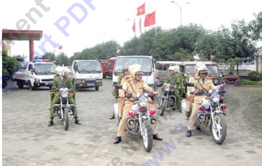
Ra quân thực hiện Năm An toàn giao thông 2012

Theo Ban ATGT Hà Tĩnh, TNGT trong 8 tháng đầu năm đã được kiểm chế và giảm thiểu so với cùng kỳ. Hà Tĩnh là tỉnh được Ủy ban ATGT Quốc gia đánh giá cao vì đã có những giải pháp mang tính đột phá để kéo giảm mạnh TNGT ở cả 3 tiêu chí về số vụ, số người chết và bị thương. Cụ thể số vụ giảm 36%, số người chết giảm 40%, số người bị thương giảm 63%.