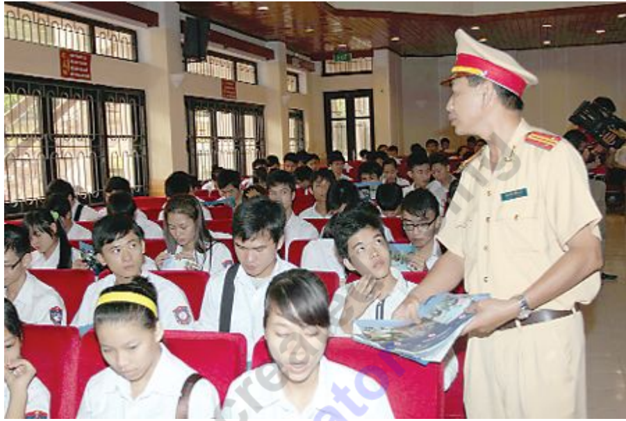
CSGT Hà Tĩnh phát tài liệu tuyên truyền ATGT cho đoàn viên, thanh niên tại cuộc thi “Thanh niên Hà Tĩnh với ATGT”

Tại Hội nghị trực tuyến sơ kết công tác đảm bảo TTATGT 6 tháng đầu năm 2012, Hà Tĩnh được Ủy ban ATGT Quốc gia đánh giá điển hình là địa phương đã triển khai tổ chức ký cam kết ATGT, nghiêm cấm sử dụng rượu bia trong giờ làm việc và buổi trưa các ngày làm việc, đưa tiêu chí về ATGT vào bình xét thi đua cuối năm đối với các tổ chức, cá nhân; là địa phương giảm thiểu được TNGT trên 20% cả 3 tiêu chí. Mới đây, Ban ATGT Hà Tĩnh đã thống nhất thông qua 10 nhiệm vụ trọng tâm từ nay đến cuối năm với mục tiêu giảm 20% TNGT một cách bền vững.