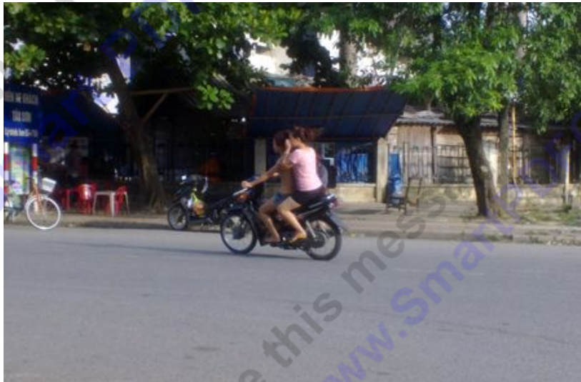
Không chỉ có nam thanh, nữ tú không đội mũ bảo hiểm khi ra đường...

Có mặt tại thị trấn Tây Sơn (huyện Hương Sơn, Hà Tĩnh) không khó để nhận ra thực trạng người dân thân nhiên đầu trần đi xe gắn máy. Trên cả tuyến phố dài, cảnh người người dân ngược xuôi bằng xe máy mà không đội mũ bảo hiểm không đếm hết. Thành phần vi phạm không chỉ gói gọn ở lớp thanh niên mà có cả những người lớn tuổi. Đáng ngạc nhiên là tình trạng này diễn ra rất phổ biến, công khai nhưng không thấy được chấn chỉnh.