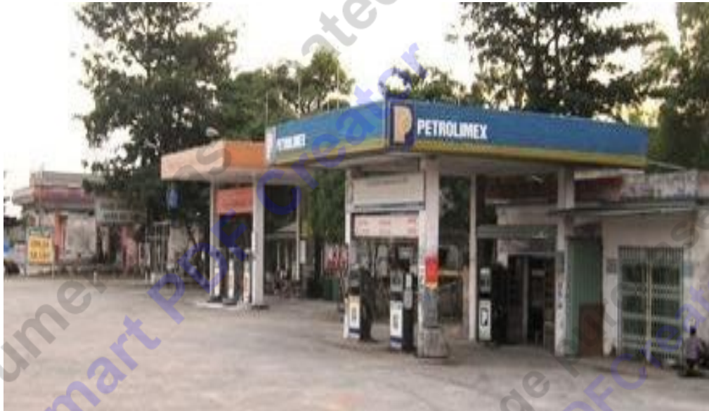
Tại khu vực Cầu Rong (xã Xuân Hồng – Nghi Xuân) trong phạm vi 400 mét nhưng có đến bốn cửa hàng KDXD.