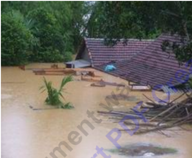
Nhiều hộ nghèo sẽ an toàn hơn khi có chòi chống lũ - Ảnh minh họa

(Chinhphu.vn) - 100 hộ nghèo của Hà Tĩnh sẽ được vay vốn ưu đãi để xây chòi chống lũ với mức tối đa không quá 10 triệu đồng/hộ trong vòng 10 năm.