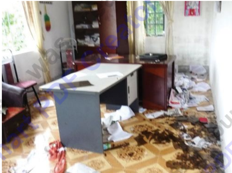
Trụ sở UBND xã Yên Lộc bị hàng trăm người gây rối đập phá tan tành