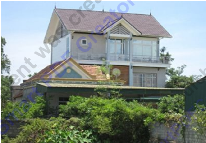
Ngôi biệt thự 3 tầng của gia đình một lãnh đạo xã Xuân Viên.

TP - Bí thư Đảng ủy xã Xuân Viên (Nghị Xuân, Hà Tĩnh) thừa nhận có đến hơn 30 suất đất của người dân trong xã được nhiều cán bộ nhờ đứng tên mua. Trong số này, có nhiều cán bộ cấp huyện và các sở ngành trên tỉnh.