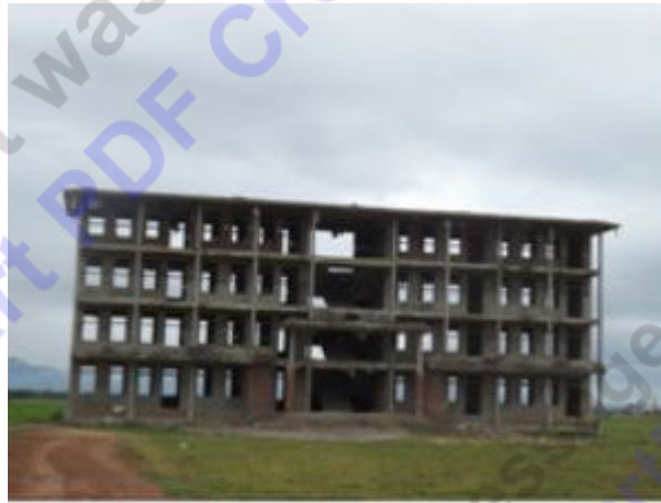
Trường THPT Mai Kính với tổng mức đầu tư 31 tỷ 370 triệu đồng để... bỏ hoang.

Theo dự án, Trường THPT Mai Kính do UBND huyện Thạch Hà làm chủ đầu tư, với tổng mức đầu tư 31 tỷ 370 triệu đồng. Nhà thầu là Công ty CPXD 22-12 Hà Tĩnh; đơn vị tư vấn thiết kế là Cty THH tư vấn hội xây dựng Hà Tĩnh, việc giám sát do Cty CP TVXD Hà Tĩnh thực hiện.