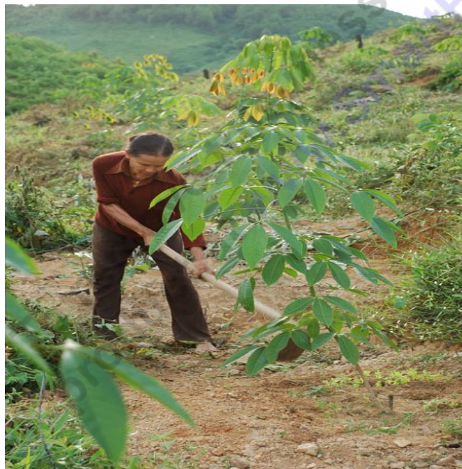
Công nhân làm cỏ, chăm bón cây cao su tại Nông trường Cao su Sơn Hồng.