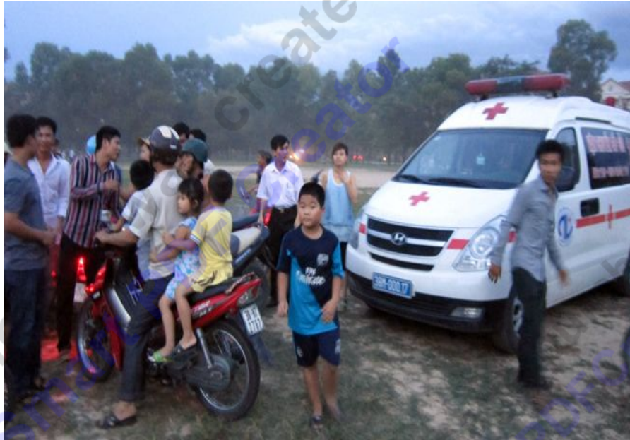
Xe cấp cứu chuyển bệnh nhân ra máy bay trực thăng trong sự hiếu kỳ của người dân