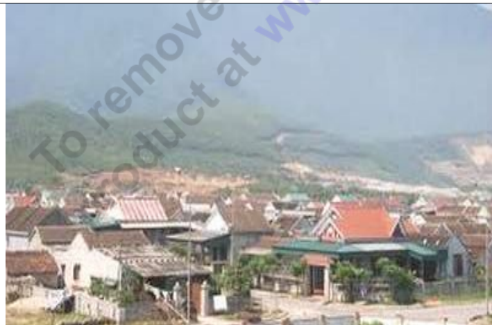
Một góc khu đất tái định cư Kỳ Phương, Hà Tĩnh.

Vốn sống quen với nghề chài lưới, ruộng đồng, nay đến khu ở mới trên núi cao, chỉ có 400m 2 trong tay và không có nghề nghiệp gì ổn định, mỗi ngày ông chỉ biết quanh quẩn cuộc xới mảnh vườn nhỏ ven nhà cho vơi nỗi nhớ ruộng đồng. Ông Thủy cho biết, trước đây ngoài đi biển đánh cá thì ruộng nương mỗi năm cũng được 3, 4 tấn thóc, rau cỏ trồng được, lên đây cái gì cũng phải mua cả, nếu có thêm thịt thì cũng phải vài bữa mới dám mua chứ đâu có tiền. Mặc dù được hỗ trợ đền bù một số tiền khá lớn, tuy nhiên với những người dân nghèo bao năm chân lấm tay bùn, việc tính toán sử dụng số tiền trên sao cho hợp lý, hiệu quả là điều không dễ.