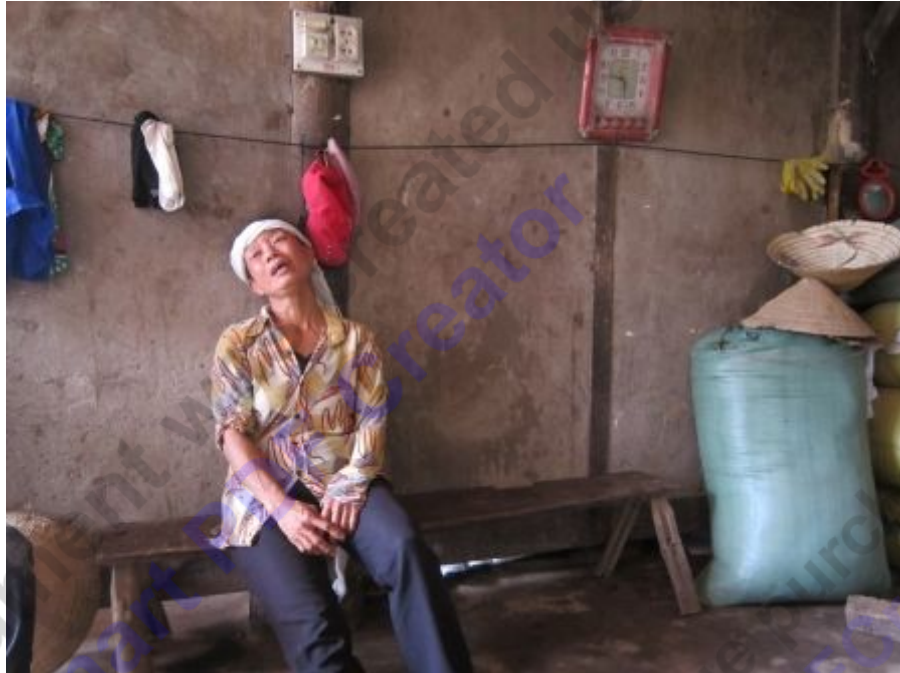
Bà V buồn sầu khi nói về bi kịch đau thương của gia đình mình.

Ngôi nhà cấp bốn toành toành đã nghèo lại càng nghèo hơn, hạnh phúc gia đình không còn trọn vẹn, không khí trong nhà nặng nề hơn bởi hình ảnh người cha say xỉn suốt ngày. Mà quái ác là hễ cứ uống rượu vào là ông C mất hết tính người, như một con thú hoang, hét đánh vợ lại chửi con. "Bạo lực gia đình" cứ tiếp diễn từ năm này sang năm khác.