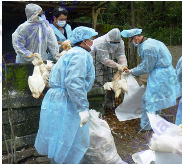
Tiêu hủy gia cầm bị dịch tại huyện Cẩm Xuyên.

Ổ dịch cúm gia cầm đầu tiên xuất hiện từ ngày 23.7, tại thôn 11, xã Cẩm Quan, huyện Cẩm Xuyên, với 379 con gia cầm bị ốm chết phải tiêu hủy. Sau đó dịch bùng phát tại xã Cẩm Thạch (huyện Cẩm Xuyên) và xã Thạch Tân (huyện Thạch Hà). Đến nay có thêm 2 xã có dịch, tổng số gia cầm bị dịch cúm H5N1 buộc phải tiêu hủy trên địa bàn Hà Tĩnh lên tới trên 42.000 con.